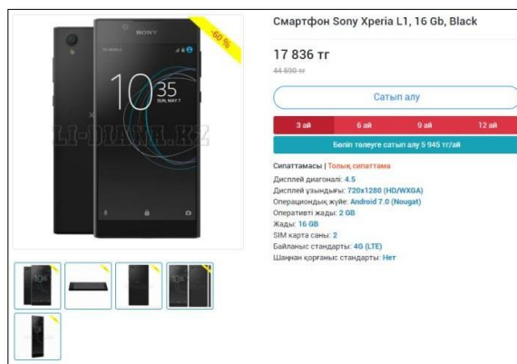
сурет – Тауарды рәсімдеу

төлеуге сатып алу» мүмкіндігін қолданып, рәсімдеу процестеріне өте аласыз (3-сурет).